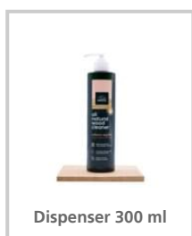
Dispenser 300 ml